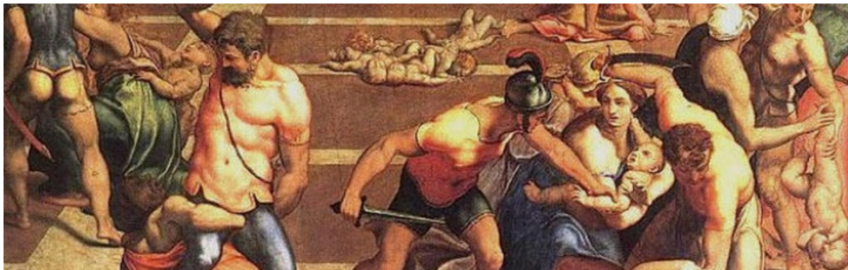
De razernij van Herodes

Koning Herodus, bijgenaamd de Grote, overleed in het jaar vier voor onze jaartelling. Toen was Jezus dus al ongeveer drie jaar oud. De beruchte massamoord op kinderen te Bethlehem vond ongeveer één à twee jaar eerder plaats. Herodus liep toen al tegen de 70. Waarom beging hij aan het einde van zijn leven nog zo'n zware misdaad? Het was niet alleen omdat de Babylonische sterrenkundigen hem hadden verteld dat er een nieuwe koning zou zijn geboren. De bijna 70-jarige Herodus zou van een pasgeboren koninkje tijdens zijn nog resterende levensjaren geen concurrentie meer te duchten hebben gehad. Herodus schrok echter hevig toen de wijzen hem vertelden dat het een Joodse koning zou zijn. Herodus behoorde zelf namelijk niet tot het Joodse volk. Hij was een Idumeër. Idumea lag ver weg, ten zuiden van Judea en ten zuiden van de Dode Zee. Het was het gebied dat in de tijd van Mozes Edom heette en de Edomieten waren om zo te zeggen de ervijanden van het Joodse volk.