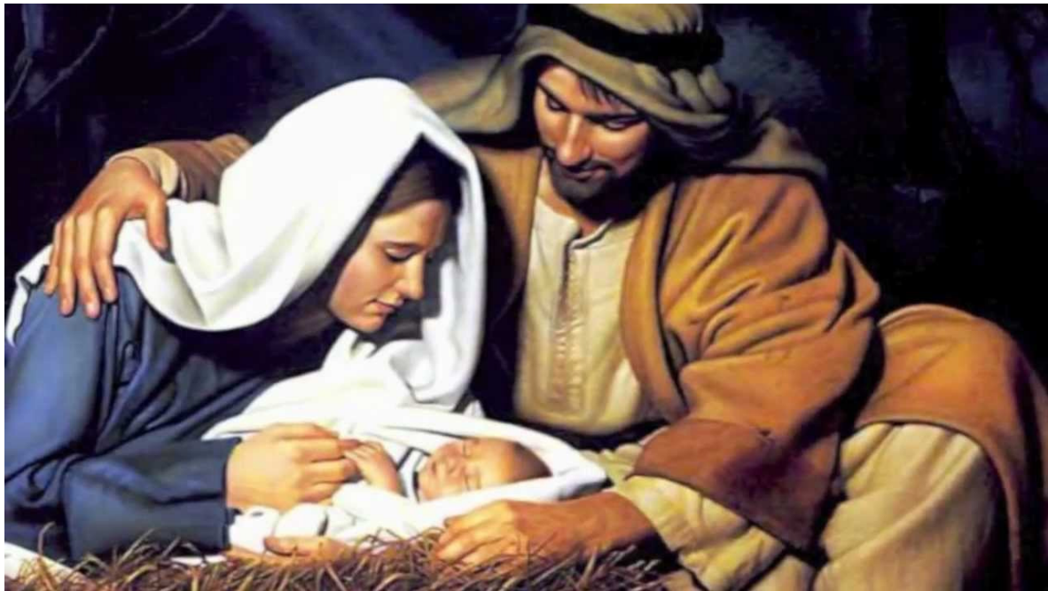
Het klassieke kerst verhaal

Zeker voor de hoog zwangere Maria die naar alle waarschijnlijkheid op een ezeltje reed waar Josef te voet naast liep. De eigenaardige volkstelling veroorzaakte uiteraard een enorme volksverhuizing en zo is het te begrijpen dat het ongebruikelijke paar in de late herfst van het jaar 7 voor onze jaartelling grote moeite had met het vinden van een onderdak. Alle gastverblijven zaten vermoedelijk al vol toen de baby zich aankondigde.