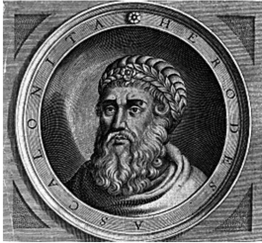
Herodus de Grote

leefden van de verkoop van de kostbare cadeaus die ze van de Babylonische sterrenkundigen hadden gekregen.